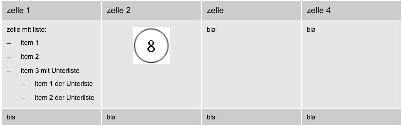
Abb. 5: Gegenüberstellung von Werten

Der Untertitel der Tabelle, hier "Gegenüberstellung von Werten" wird durch das unmittelbar nach der Tabelle folgende <p> Tag angegeben.