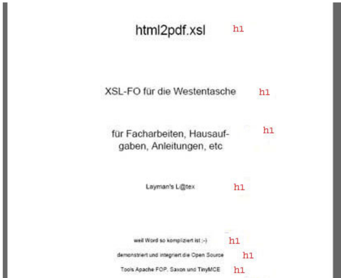
Abb. 2: die Coverseite wird bedatet durch die ersten 7 Überschriften <h1>