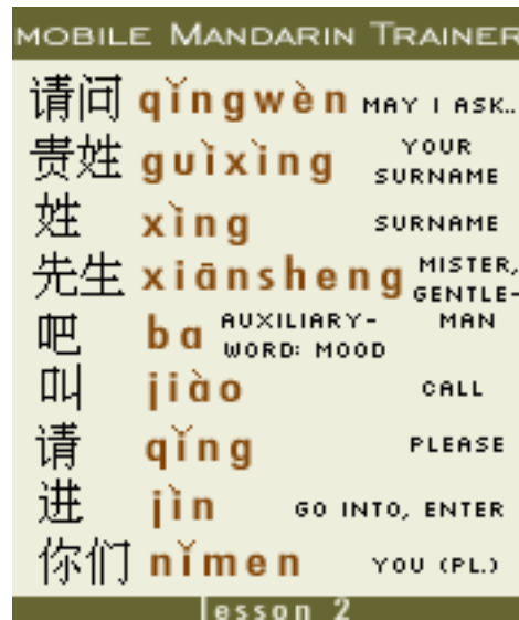
Abb. 8: Screenshot vom Handy-Mandarin-Trainer

Ein Absatz der dem Bild folgt wird als Untertitel interpretiert - das gilt nicht für Bilder in Tabellen.